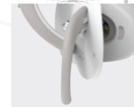
POIGNÉES DÉMONTABLES ET AUTOCLAVABLES