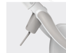
REGLAGE PROGRESSIF DE LA LUMINOSITE