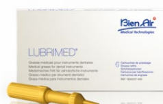
LUBRIMED Emballage de 6 cartouches REF. 1600037-006