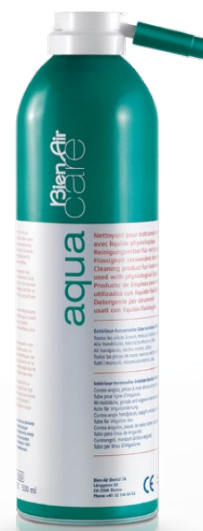
AQUACARE 500 ml spray de nettoyage. Emballage de 6 pièces REF. 1600617-006