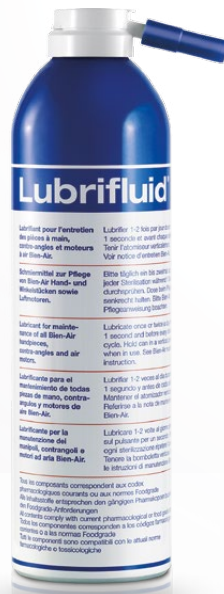
LUBRIFLUID 500 ml lubrifiant Emballage de 6 pièces REF. 1600064-006