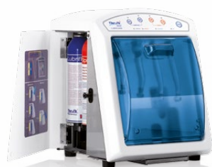
LUBRICARE Système de maintenance REF. 1600915-001