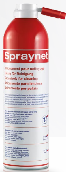
SPRAYNET 500 ml spray de nettoyage. Emballage de 6 pièces REF. 1600036-006